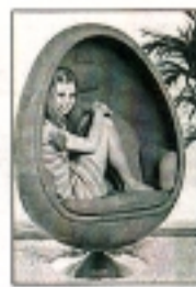
Stolen Ovalia anno 1968.