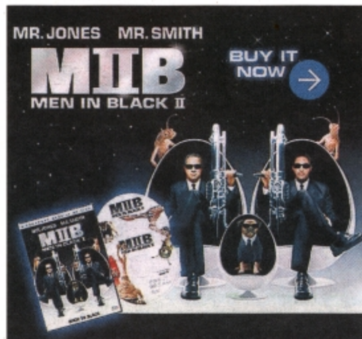
Barske menn i sort: Tommy Lee Jones og Will Smith m/hund har inntatt plassene i Ovalia-stolene i reklamen for de populære «Men in Black»-filmene. Uten lov.