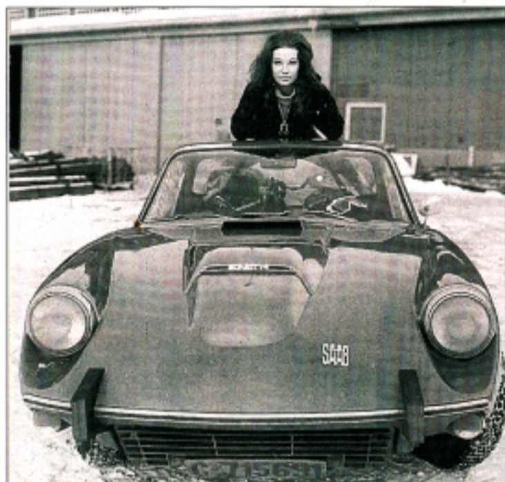
Saab Sonett – med seter formet av Henrik Thor-Larsen. Verdsatt av folk med estetisk sans. En årgangsbil som kledde tidligere kulturminister Åse Kleveland meget godt og ble lagt merke til da hun kjørte rundt i Oslos gater.

– Fra 1968 til 78 solgte jeg tusenvis av eggstoler over hele verden. Nå er stolen tidsriktig igjen. «Men in Black» gjorde den berømt på ny. Uten lov. Derfor har jeg laget en ny serie.